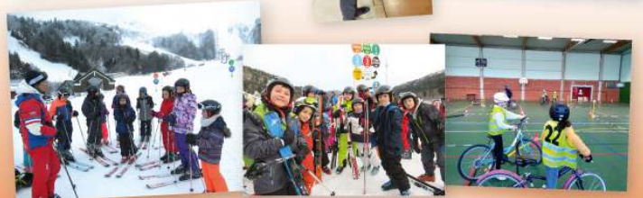
Char N°1 : PPS/PS/ et PSMS - La Rochère