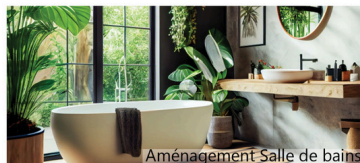
Aménagement Salle de bains